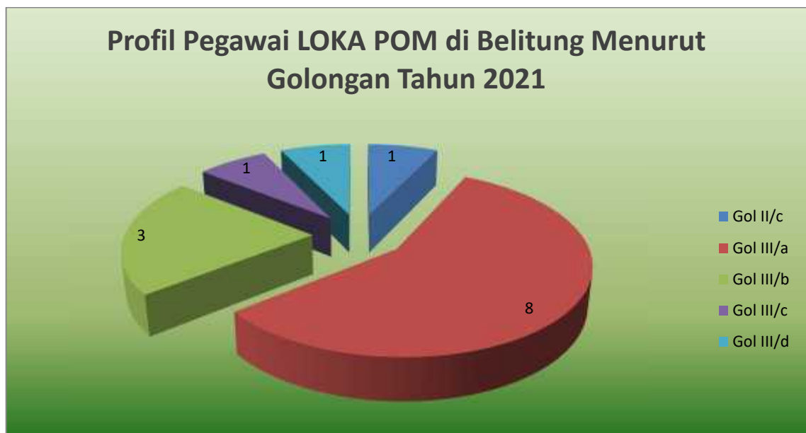
Gambar 1.4. Profil Pegawai LOKA POM di Belitung berdasar Golongan Tahun 2021