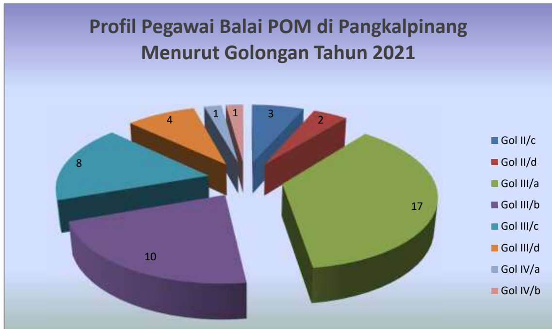
Gambar 1.3. Profil Pegawai Balai POM di Pangkalpinang berdasar Golongan Tahun 2021