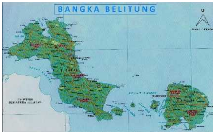
Gambar 1.5 Peta Provinsi Kepulauan Bangka Belitung

Wilayah Provinsi Kepulauan Bangka Belitung memiliki luas 18.725,14 km 2 , dimana sebagian besar merupakan wilayah perairan mencapai 79,90%.