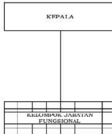
Gambar 1.2 Struktur Organisasi Loka POM di Kabupaten Belitung